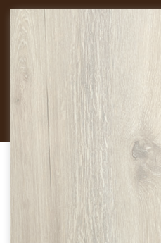
701 PLATÓN **