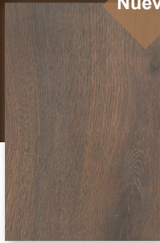
559 ROBLE CARMIN **