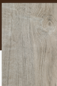
619 ROBLE CERDEÑA *