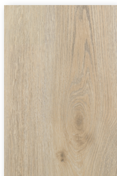
702 ARISTÓTELES **