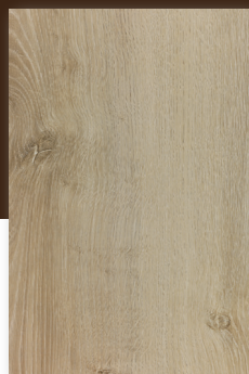
435 JEFFERSON **