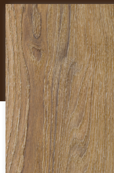
622 ROBLE BALEARES *