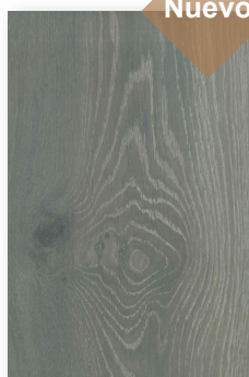
708 ULISES **