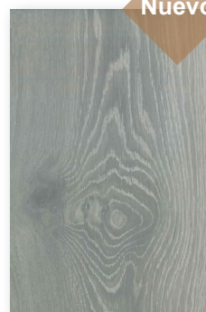
707 GORGAS **